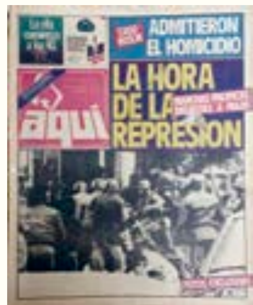
58. Aquí . 5 de junio de 1984.

merosas pancartas que colocaban en el espacio público temas hasta entonces vedados. 81 En los carteles que se colaban en las fotos panorámicas de los actos se leían consignas a favor de la amnistía para los presos políticos, denuncias sobre la existencia de detenidos desaparecidos y demandas por mejores salarios.