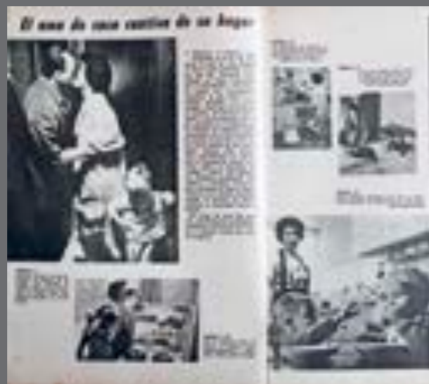
23. Mundo Uruguayo , 19 de agosto de 1964.

Por otra parte, las portadas de Mundo Uruguayo dieron cuenta, ocasionalmente, de un modelo de mujer desinhibida y sensual, material-