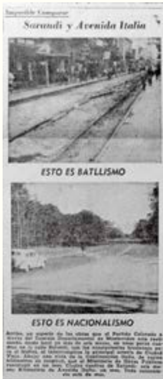
11. El País , 3 de abril de 1965.