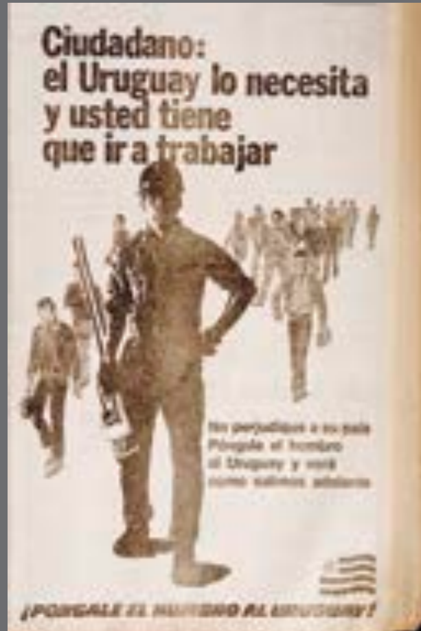
43. El País. 7 de julio de 1973.