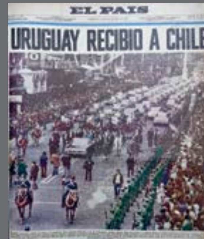
49. El País . 22 de abril de 1976.