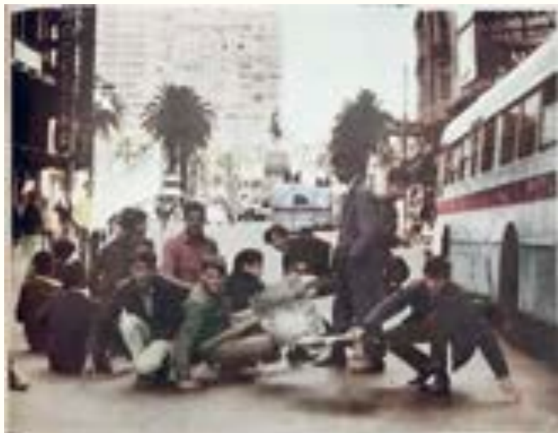
29. El BP color ofreció en varias ediciones una representación menos sesgada de las protestas estudiantiles ocurridas entre mayo y setiembre de 1968 y su represión. La foto publicada en portada el 12 de mayo estuvo acompañada de una leyenda que no omitía mencionar los incidentes ocasionados por los manifestantes pero explicaba que era “una nueva forma de protestar” por un tema que les tocaba de cerca, como lo era el aumento del precio del boleto estudiantil.

aparecían retratados con las mismas connotaciones: auxiliando a la población afectada por las medidas de protesta de los manifestantes, restableciendo el orden en la vía pública (ubicando ornato público en su sitio, habilitando el tránsito en lugares obstaculizados por las improvisadas barricadas estudiantiles) o concretando detenciones pero de manera pacífica y, por norma general, sin que mediase el empleo de armas de fuego. 45 Un buen ejemplo de esta actitud mesurada y protectora de las fuerzas de seguridad puede encontrarse en las fotos que informaron sobre las jornadas de militarización del mes de julio de 1968, en las que se representó a los agentes policiales como los que “vigilan y protegen sectores clave de la producción”. Las leyendas que acompañaban las fotos enfatizaban la “rápida y serena intervención policial”. 46 En suma, prácticamente no se publicaban fotografías en las que efectivos policiales y