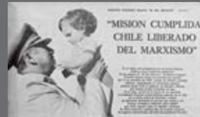
48. El País . 4 de mayo de 1980.

En mayo de 1980 El País comunicó que empezaría a publicar, en carácter exclusivo, los aspectos más sobresalientes de “El día decisivo”, un texto escrito en forma de reportaje en el que Pinochet revelaba distintos aspectos de su vida y su cruzada anticomunista. Un recuadro de media página, que incluía la foto del dictador de perfil aupando a un niño, anunciaba: “Misión cumplida: Chile liberado del marxismo”. Entre el 4 y el 9 de mayo se publicaron partes de varios capítulos del libro en cuestión, acompañados de fotos que proyectaban una imagen paternal del dictador, rodeado de apoyo popular.