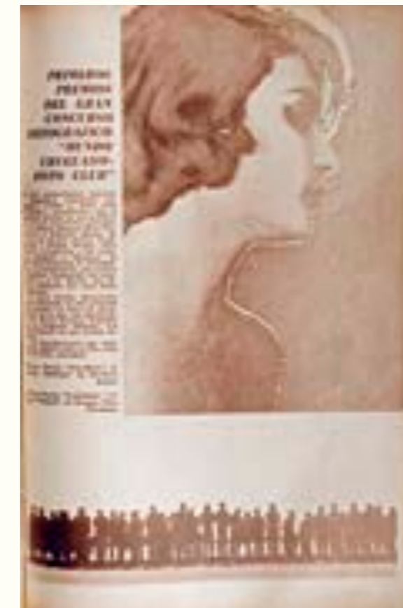
5. Mundo Uruguayo , 30 de enero de 1963.

consejos sobre técnica y estilo, estos medios tuvieron un importante rol en la difusión de las distintas modalidades de enseñanza de la fotografía. En el período comprendido entre 1959 y 1985 esta tendencia se vio particularmente acentuada por el desarrollo de la actividad fotoclubística y la creación, en 1959, de la Asociación de Reporteros Gráficos (ARGU), que agrupaba a los fotógrafos en actividad en diversos medios de prensa local. Pueden identificarse tres grandes áreas te-