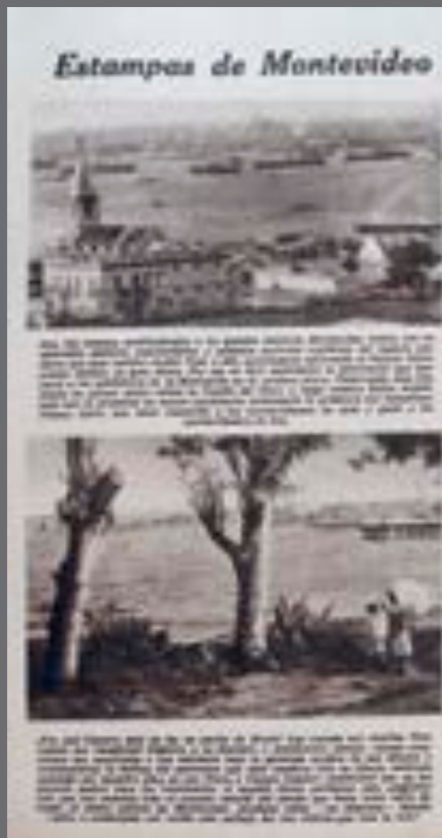
9. Mundo Uruguayo , 21 de abril de 1960.

La publicación de fotografías históricas contribuyó al complejo proceso de construcción de una memoria histórica que visibilizó ciertos lugares, acontecimientos, personajes y sectores sociales, proponiendo una síntesis representativa de la esencia uruguaya. Hacia comienzos de los años sesenta todavía mantenía vigor un imaginario social que proyectaba la idea de un