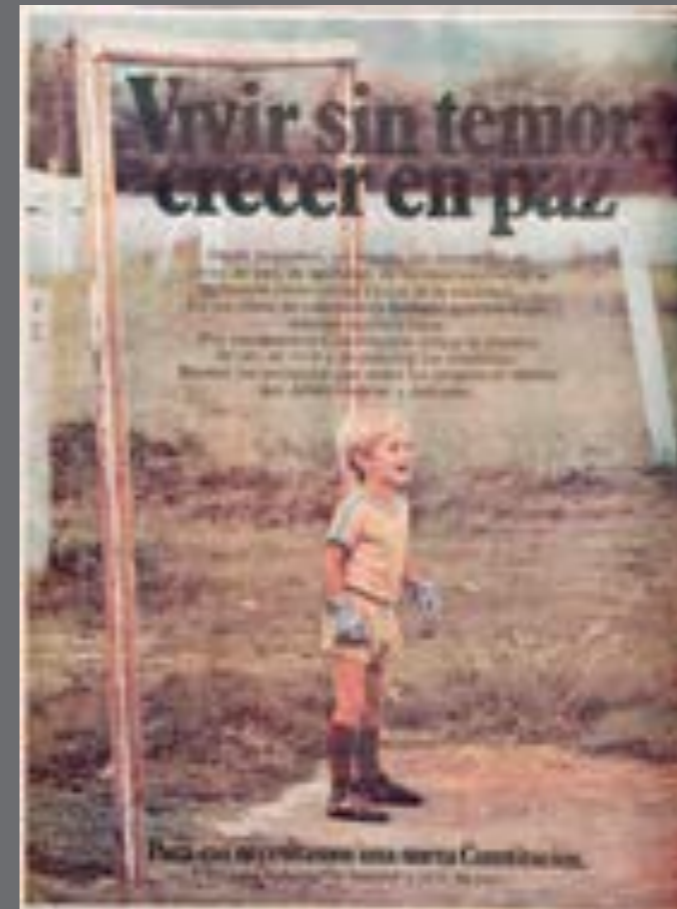
45. El País. 10 de noviembre de 1980