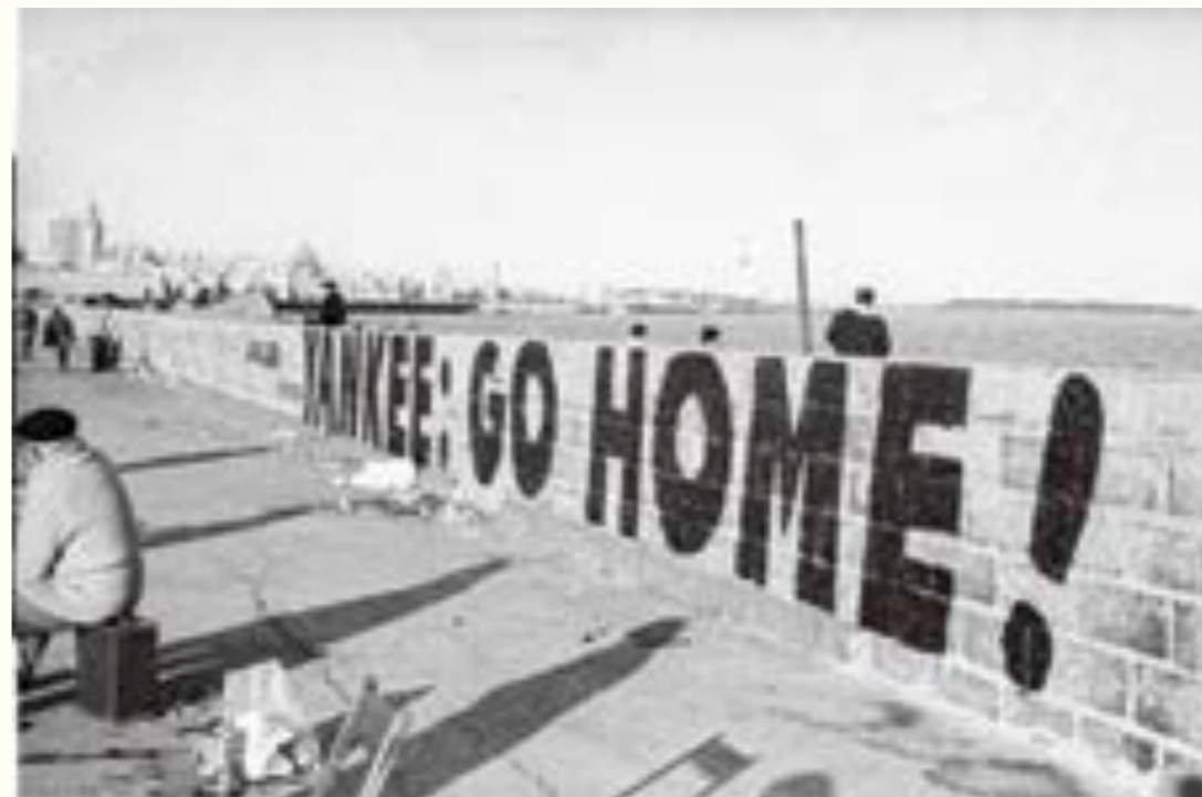
El Popular reflejó en varias oportunidades el sentimiento antiestadounidense experimentado por amplios sectores sociales. Esta fotografía fue publicada en el diario el 12 de setiembre de 1964 con la siguiente leyenda: “Llegaron ayer al puerto de Montevideo dos barcos de guerra norteamericanos, ‘Norfolk’ y ‘John Wilis’ que participan en las maniobras de guerra conocidas con el nombre de ‘Unitas V’ que se están realizando en nuestras costas. Al virar sobre la boca de entrada al Puerto, las marinerías formadas en cubierta lo primero que vieron fue la inscripción que lucía la escollera Sarandí y que recoge la nota gráfica”.

En 1968 fueron numerosas las protestas callejeras de estudiantes y trabajadores en contra de la política económica del gobierno, que retaceaba recursos financieros a la enseñanza media y a la Universidad y no se mostraba receptivo a los reclamos de sectores asalariados y pasivos, cuyas condiciones de vida habían empeorado progresivamente en el último decenio. Por otra parte, en ambos colectivos predominaba una sensibilidad de izquierda que los alineaba en el rechazo a la injerencia del gobierno de Estados Unidos en asuntos del país y del resto del continente. Aunque no era algo novedoso, desde este momento fue cada vez más común que en las marchas de trabajadores y estudiantes –al igual que en las de la izquierda partidaria– se escucharan consignas “antiyanquis” o se sucedieran ataques a edificios vinculados al gobierno estadounidense o a otros íconos