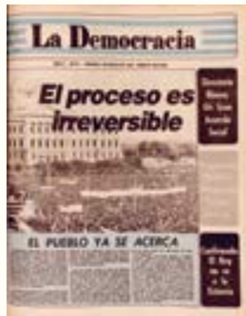
57. La Democracia . 6 de mayo de 1983.