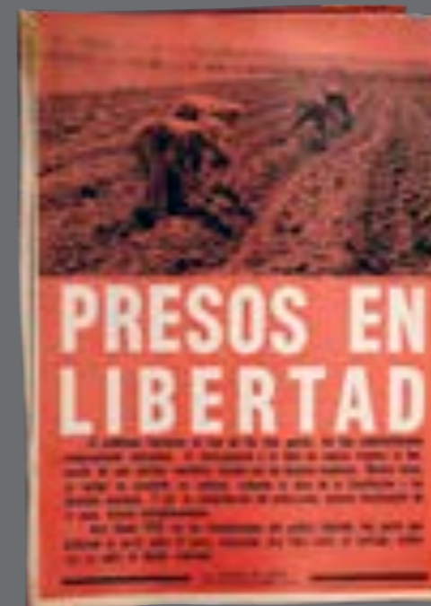
21. Mundo Uruguayo, 8 de noviembre de 1961.