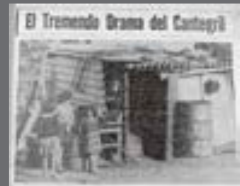
17. El Popular , 6 de julio de 1964.