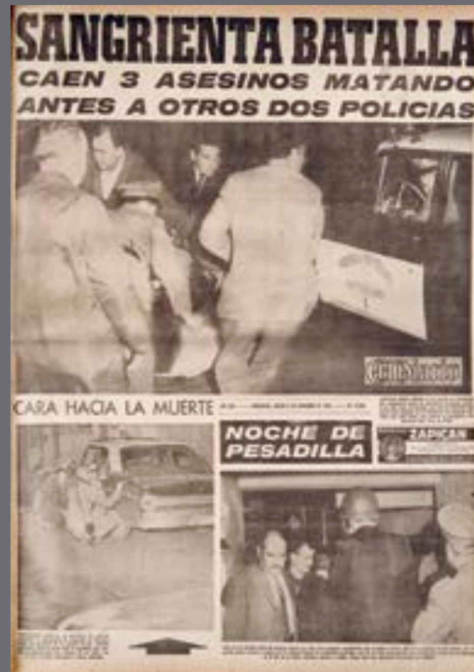
8. Portada de El Diario , 6 de noviembre de 1965.

Durante los años sesenta la crónica roja comenzó a incluir imágenes captadas "en el momento de los hechos", realizadas por los fotógrafos mediante el uso de cámaras compactas. La cobertura del enfrentamiento entre la Policía y un grupo de asaltantes argentinos en el edificio Liberaj, en noviembre de 1965, es un ejemplo de los cambios y continuidades de la crónica policial de esa época con respecto a los años anteriores. El enfrentamiento fue cubierto en vivo y profusamente fotografiado: las imágenes mostraron policías cubiertos con máscaras de gas disparando ametralladoras, vecinos rescatados en medio de la balacera, cadáveres y destrucciones en el edificio. Los días anteriores la prensa había acompañado las pesquisas que las autoridades llevaban a cabo por la ciudad buscando a los delincuentes. Algunas fotografías (escenificadas o descontextualizadas) sugerían que la prensa estaba tan encima de los hechos como la Policía de los criminales.