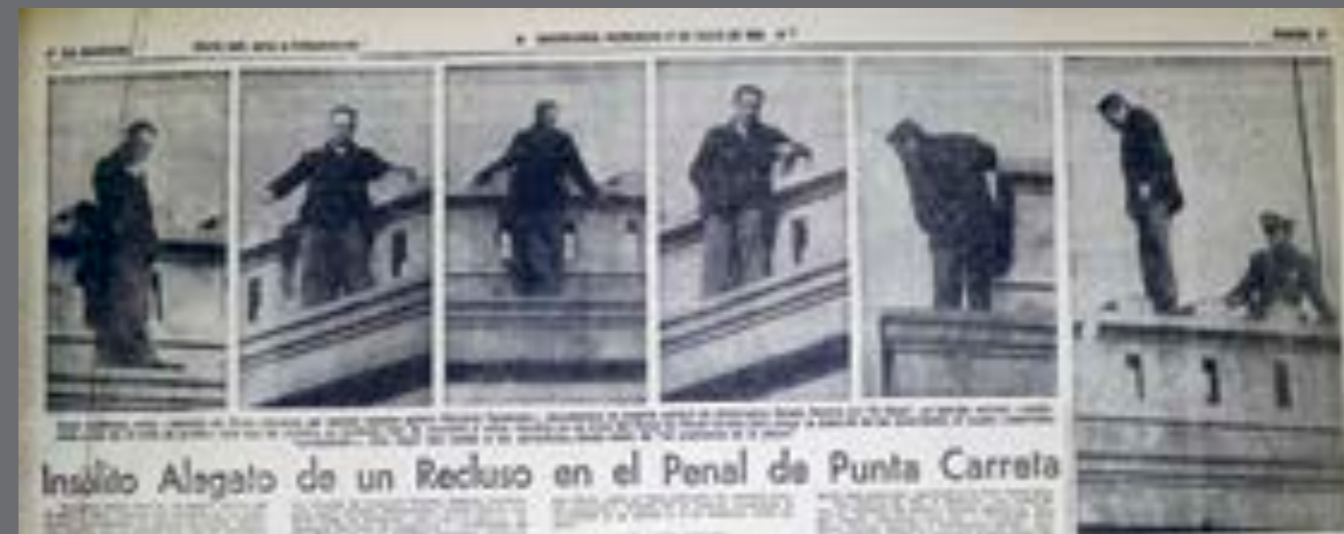
20. La Mañana, 1 de julio de 1964.