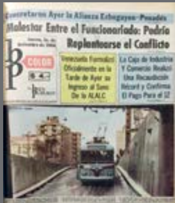
3. Portada de BP Color del 1 de setiembre de 1966, informando sobre la inauguración del túnel en la Avenida 8 de octubre y Bulevar Artigas.

[César Bianchi, “Recuerdos de BP Color. Un diario que supo innovar”, El País digital , 21 de febrero de 2003].