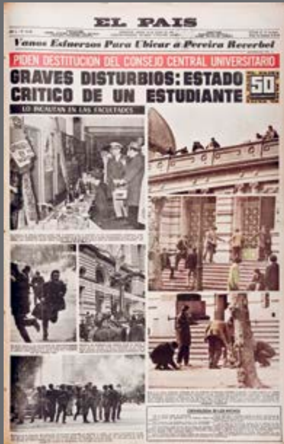
1. Portada de El País , 10 de agosto de 1968.