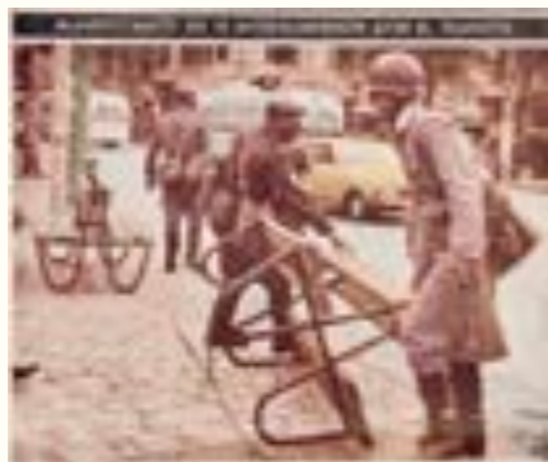
30. Foto publicada en El País el 15 de mayo de 1968 con el siguiente pie: “Plaza Libertad, al atardecer. Los estudiantes han desplazado los bancos hasta la arteria para interrumpir puntualmente el paso de cada unidad de la empresa CUTCSA, la única víctima de sus iracundas muestras de protesta. La rápida y serena intervención policial dispuso la manifestación, una de las tantas que se registraron ayer en Montevideo”.

En las coberturas gráficas de las movilizaciones de 1968, los otros protagonistas fueron los estudiantes (representados en mucha mayor medida que los trabajadores) que encarnaban colectivamente el prototipo del sujeto violento. Las fotos de El País los mostraron con frecuencia como atacantes, protagonizando verdaderos combates a pedradas –algunas tomas captaban el instante decisivo en que lanzaban los improvisados proyectiles, mientras que otras los retrataban en el momento de recoger trozos de baldosas u otros objetos contundentes–, parapetados detrás de improvisadas barricadas o huyendo a refugiarse dentro de las casas de estudio. La