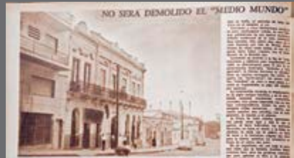
18. Suplemento dominical de El Día , 12 de marzo de 1960.