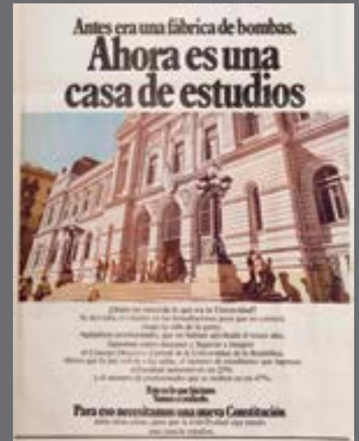
46. El País. 14 de noviembre de 1980.