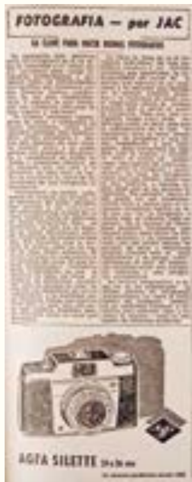
7. Sección "Fotografía por JAC". La Mañana , 8 de Julio de 1960.

fotografía" mostrando la popularidad de la actividad fotográfica profesional y amateur en Uruguay y en el mundo. También eran usuales las recomendaciones para aprender la técnica fotográfica. La Mañana mantuvo la columna "Fotografía por JAC", inaugurada a mediados de la década de 1950 con la finalidad de dar consejos y difundir las últimas novedades en materia de técnicas sobre fotografía. En Mundo Uruguayo , a mediados de