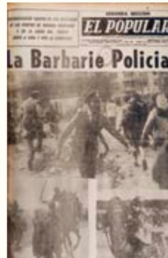
25. Portada de El Popular , 18 de setiembre de 1964.

En setiembre de 1964, en el contexto de un clima político enrarecido por el decreto gubernamental mediante el cual Uruguay rompió relaciones diplomáticas y comerciales con Cuba, los estudiantes ocuparon la Universidad de la República. Los fotógrafos de El País documentaron su evacuación, implementada y supervisada con orden por la Policía. Las imágenes publicadas mostraron a las fuerzas de seguridad en actitudes pacíficas y conciliatorias; los estudiantes eran representados con menos empatía. 43 Una de las fotos había sido tomada "in fraganti" y los retrataba "descansando plácidamente sobre el edificio de la azotea" con una leyenda que recuerda la "dramática y tensa lucha" de la noche anterior. Tomada también con prudencial distancia entre fotógrafo y fotografiados, otra foto mostraba a varios estudiantes en los