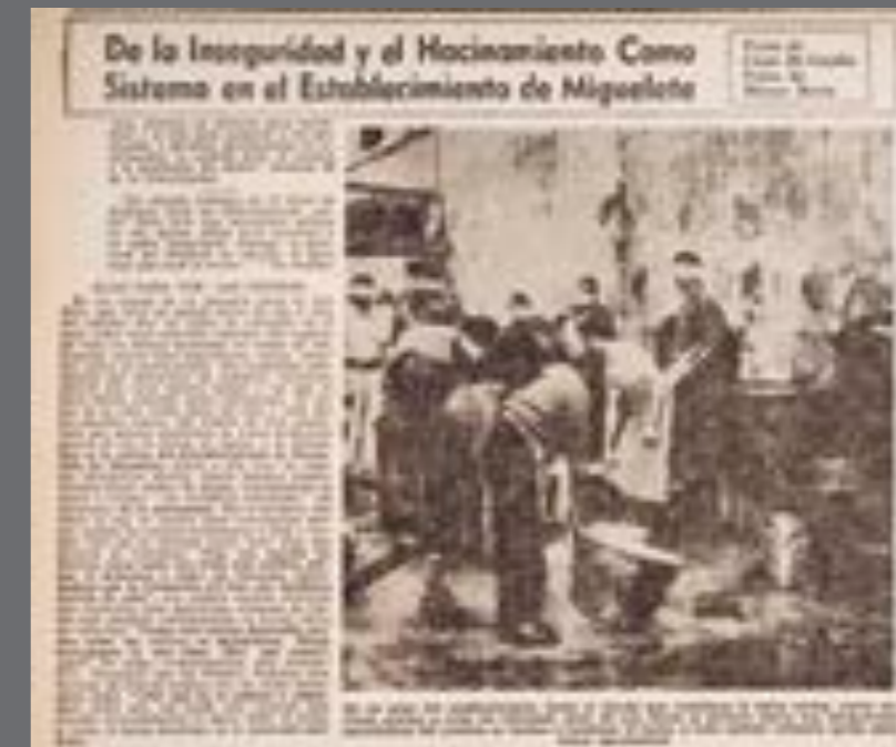
22. El País, 20 de junio de 1959.