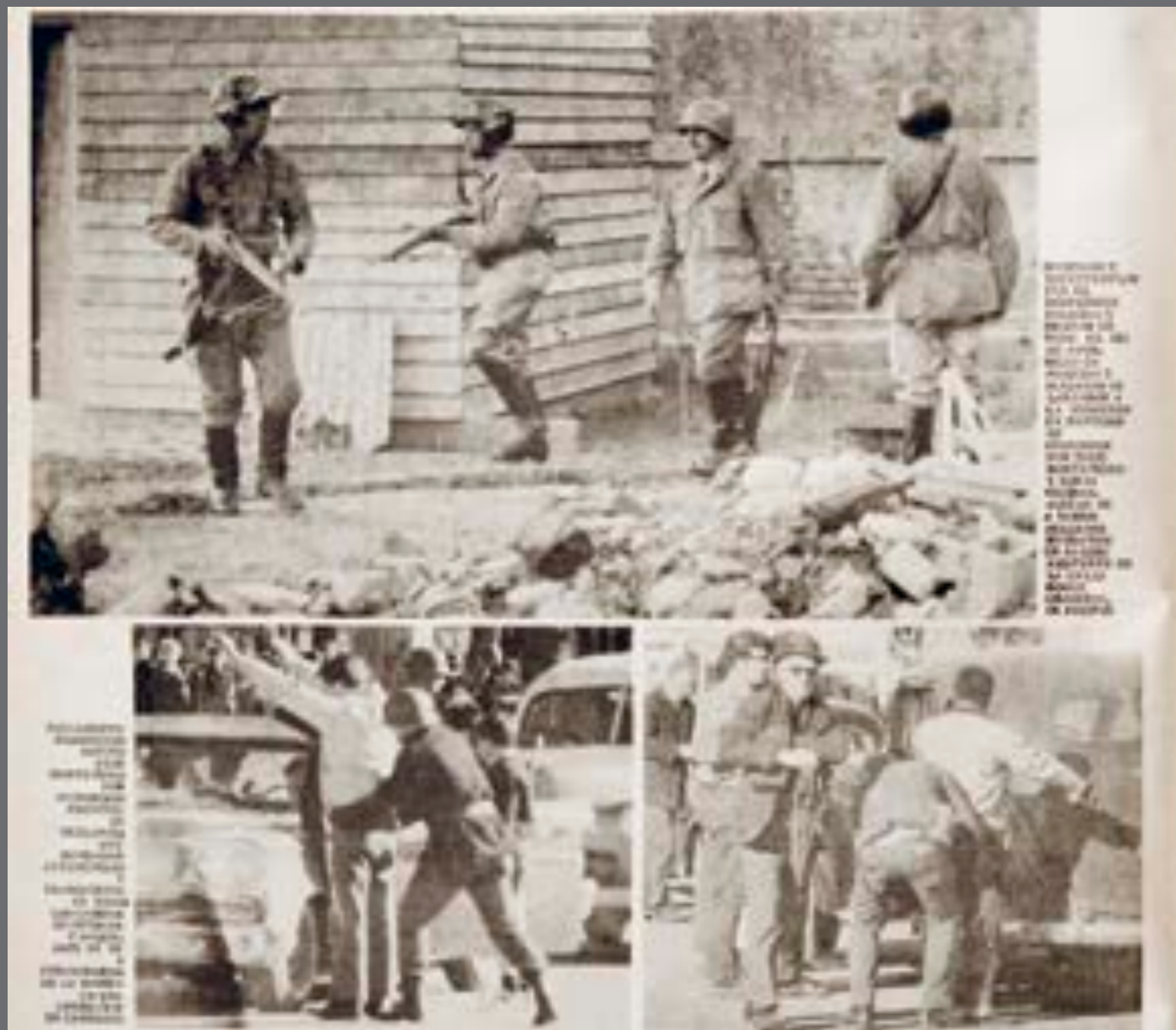
33. "Espectaculares procedimientos y extremas medidas de vigilancia", BP Color , 10 de agosto de 1970.