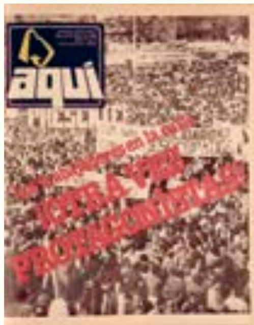
56. Aquí . 3 de mayo de 1983.