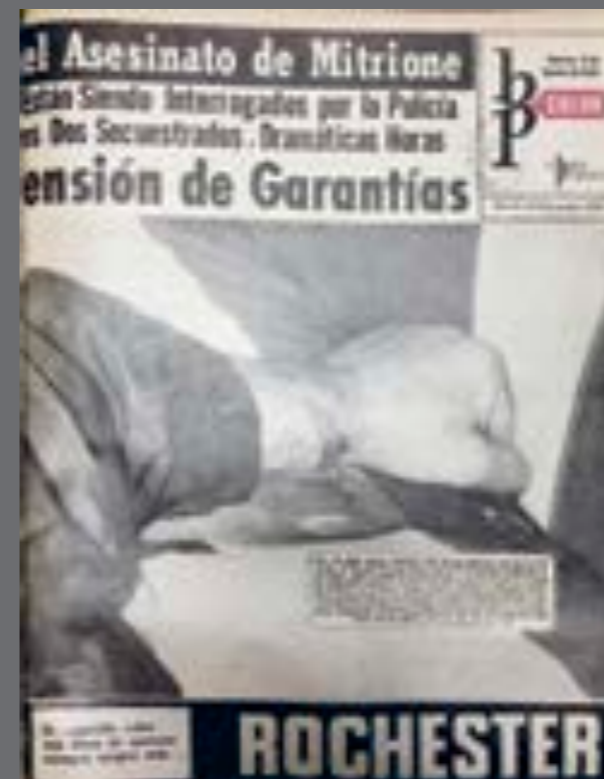
34. BP Color , 11 de agosto de 1970.

Entre 1968 y 1972 varias organizaciones armadas, como el MLN-Tupamaros, la OPR 33, las FARO y el Movimiento 22 de Diciembre, intentaron copar ciudades, tomaron provisoriamente estaciones de radio, realizaron numerosos atentados contra personas y edificios, secuestraron a políticos, diplomáticos, periodistas y empresarios y protagonizaron varias fugas carcelarias. Todos estos acontecimientos merecieron extensas coberturas fotográficas que enfrentaban el desafío de narrar retrospectivamente lo ocurrido.