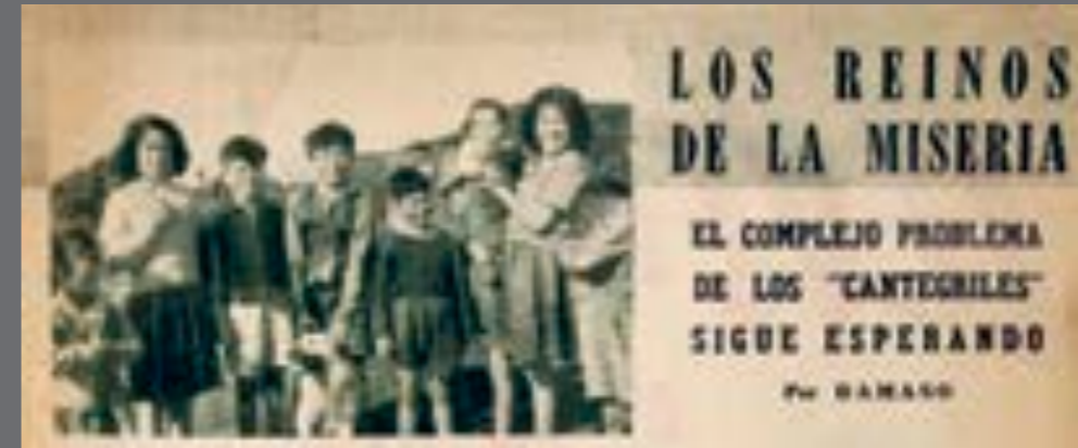
15. Mundo Uruguay , 1 de diciembre de 1960.

Habitantes de un asentamiento ubicado en Aparicio Saravia y Trápani, fotografiados en el marco de una entrevista del diario El Popular en el mes de julio de 1964.