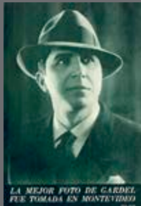
10. Mundo Uruguayo , 16 de junio de 1965.

La publicación de fotografías históricas contribuyó al complejo proceso de construcción de una memoria histórica que visibilizó ciertos lugares, acontecimientos, personajes y sectores sociales, proponiendo una síntesis representativa de la esencia uruguaya. Hacia comienzos de los años sesenta todavía mantenía vigor un imaginario social que proyectaba la idea de un