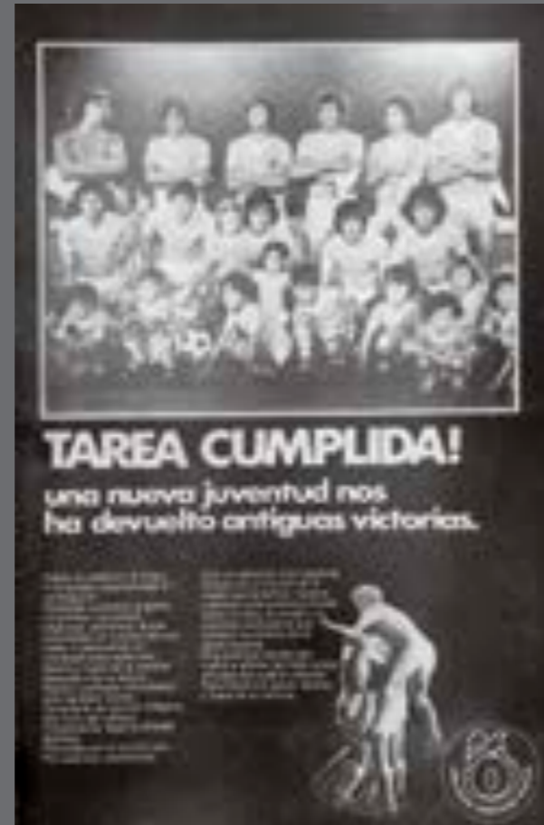
44. El País. 2 de febrero de 1979.