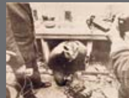
36. "Caen dos celdas subterráneas de un grupo de conspiradores", La Mañana , 5 de julio de 1972. Pie de foto: "un fotógrafo de prensa surge del refugio sedicioso localizado por las Fuerzas Conjuntas en Humberto 1o 4097, donde la organización terrorista 'OPR 33' había montado una celda para mantener reclusos a los secuestrados".

1970, después de dos meses de cautiverio. Las fotos publicadas mostraban la camilla en la que fue trasladado, los alrededores del centro hospitalario en el que recibió atención, a sus familiares y hasta el pasillo que daba a la pieza donde se encontraba internado.