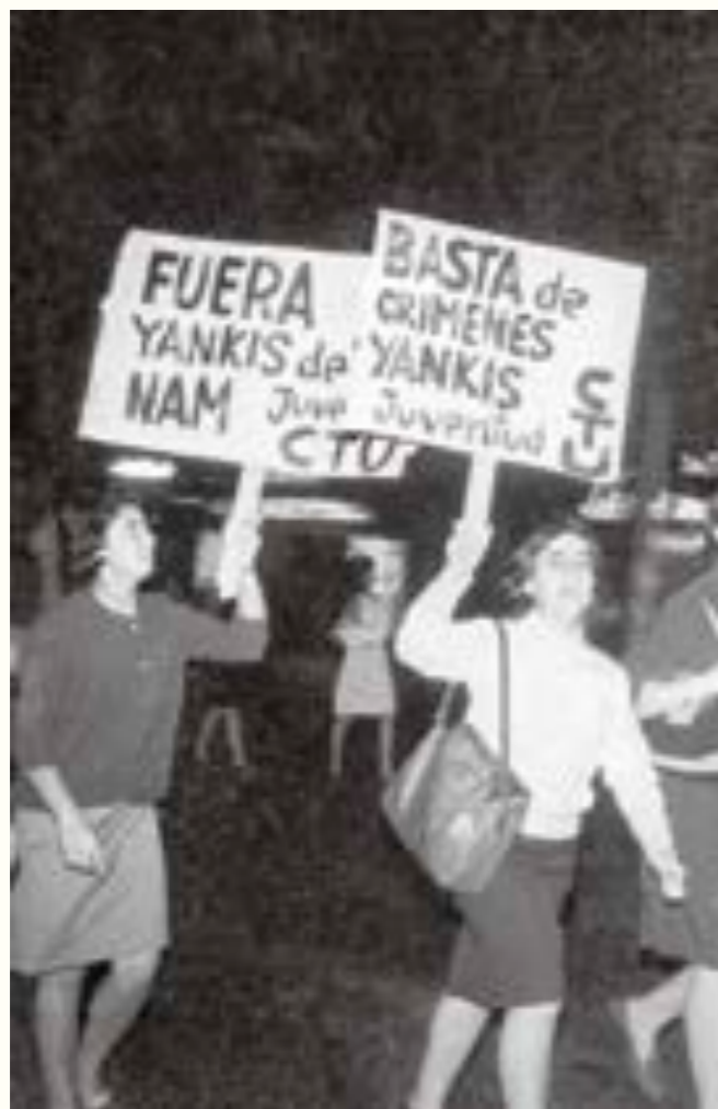
26. Manifestación por la Avenida 18 de Julio, convocada por la Comisión Juvenil de la Central de Trabajadores del Uruguay (CTU), exigiendo el retiro de las tropas estadounidenses de la Península de Indochina. El Popular . 30 de marzo de 1965.

ilustra[ba] los disturbios protagonizados por los manifestantes comunistas y solidarios con el régimen de Castro”, que habían derivado en una “batalla campal”. Otras dos fotos documentaban la partida de los diplomáticos hacia el avión y una detención “amable por parte de la policía de un ‘agitador’ que intentaba romper el cordón policial”. 44