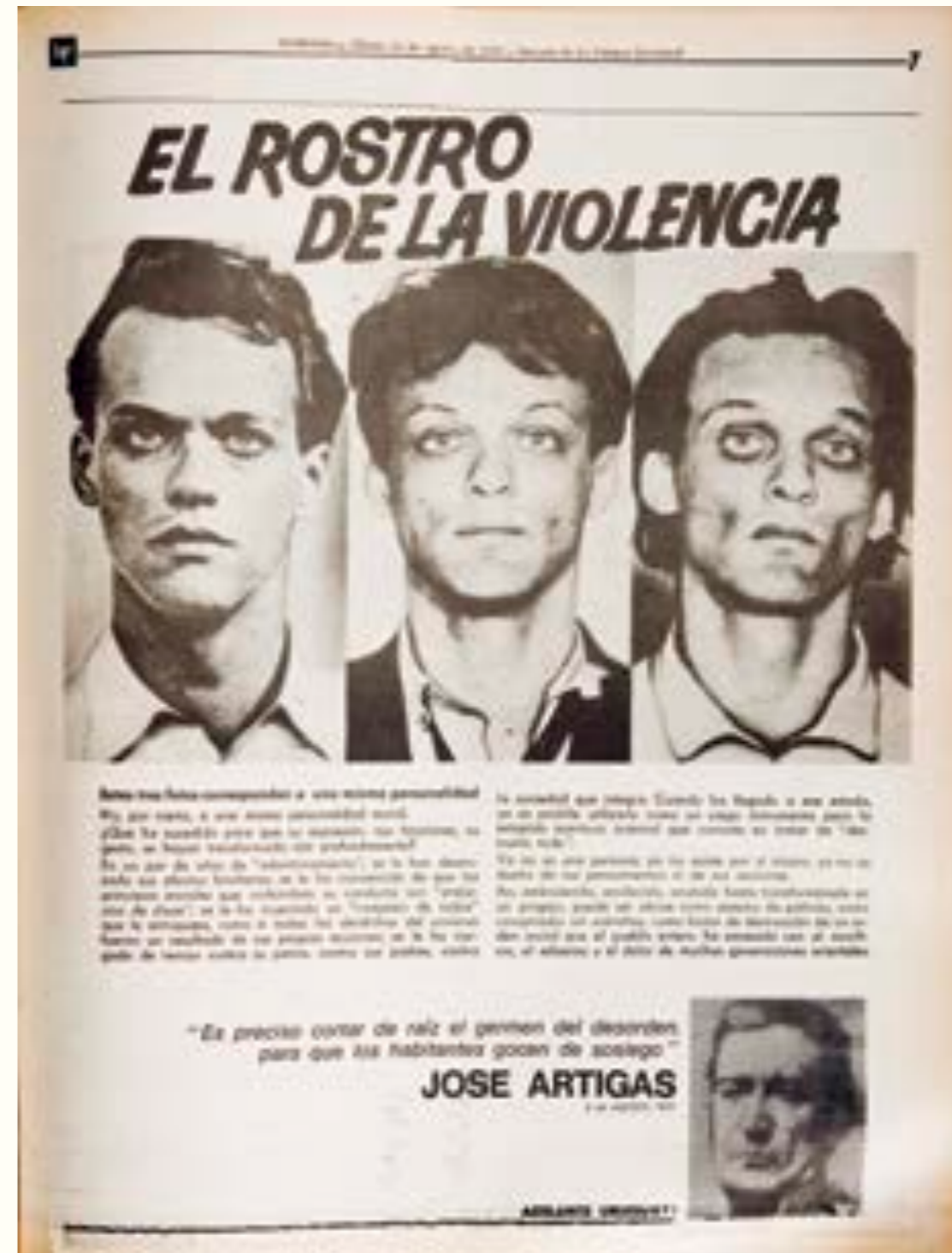
32. BP Color , 15 de agosto de 1970. La composición gráfica y el texto también fueron publicados en El País el 16 de agosto de 1970.

El mayor desafío para editores y fotógrafos radicó en representar visualmente ex post facto las acciones realizadas por estos grupos. Mediante recursos gráficos variados,