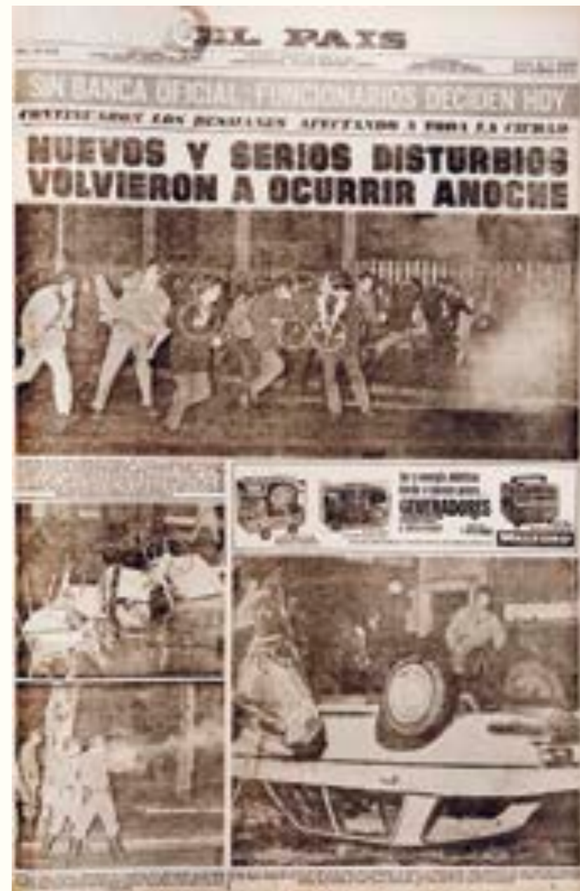
31. El País , 13 de junio de 1968.