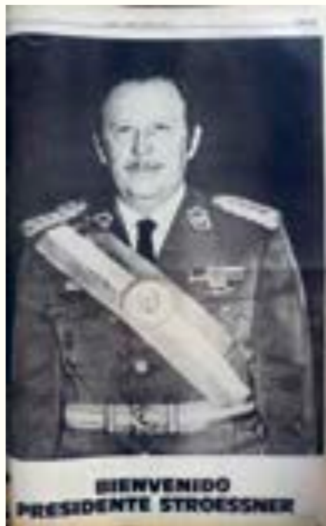
47. El País . 24 de marzo de 1976.

Una mención aparte dentro de este grupo merecen las fotografías dedicadas a la promoción del turismo en todo el país y en particular en Punta del Este, proyectado como el principal balneario uruguayo. 65