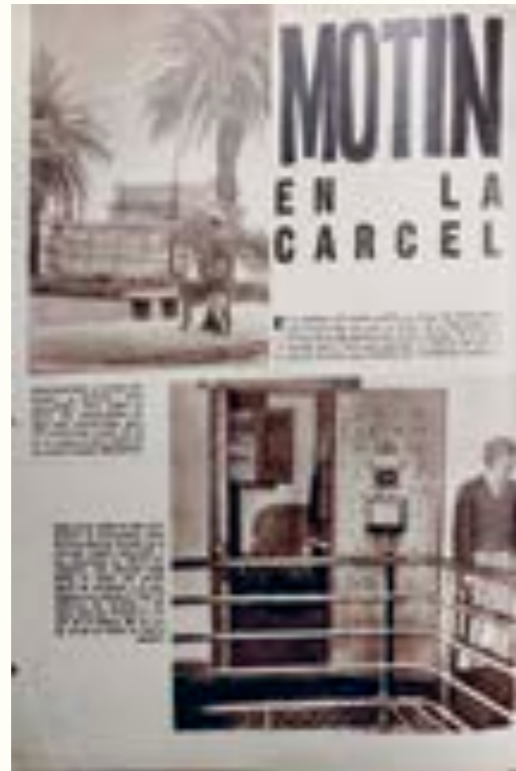
19. Mundo Uruguayo. 19 de setiembre de 1962.

El País , sobre todo después de que se conocieran los resultados del censo nacional de 1963. En 1964 varios artículos acompañados de fotografías se mantenían en la senda más propagandística –entrega de viviendas a través de créditos a largo plazo, construcción de nuevos complejos habitacionales–, mientras que en otros se proponían reflexiones más complejas de lo que seguía siendo un tema de primer orden en la agenda social. 30 En este mismo contexto, el periódico dedicó dos notas a los orígenes del asentamiento irregular ubicado en Bulevar Aparicio Saravia, en el noroeste de Montevideo, resaltando el logro que suponía la construcción de un nuevo complejo edilicio en el barrio Casavalle. 31