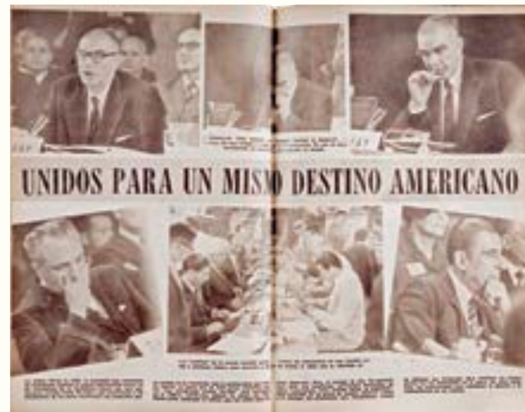
12. Cumbre de Jefes de Estado y de Gobierno de la OEA, realizada en Punta del Este entre el 12 y el 14 de abril de 1967. Mundo Uruguayo , 19 de abril de 1967.

A mediados de 1962 la expansión de los cantegriles volvió a ser objeto de dos reportajes de Mundo Uruguayo que ubicaban la