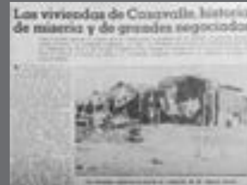
16. El País , 23 de enero de 1964.