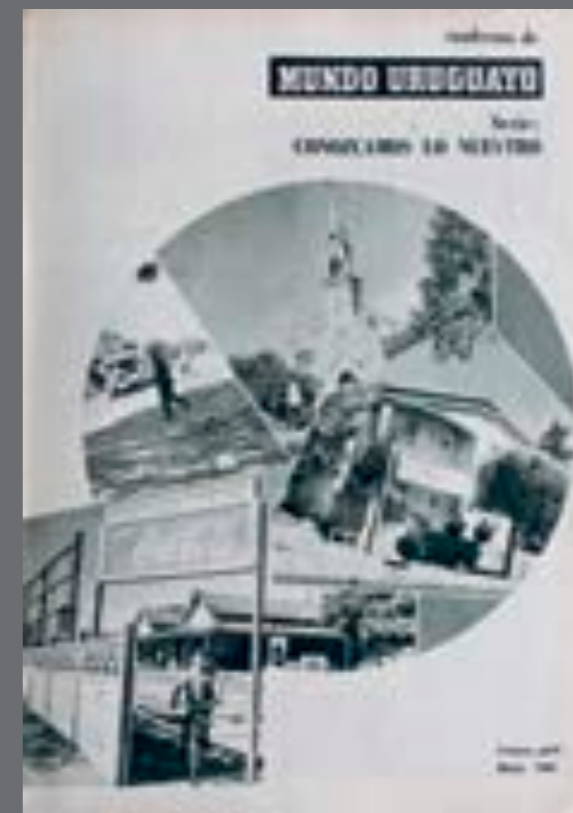
2. Portada de la separata Cuadernos de Mundo Uruguayo dedicada a la ciudad de La Paz. 31 de marzo de 1965.

[Publicidad en Mundo Uruguayo , 6 de junio y 25 de julio de 1962; “ Nuestro 45 aniversario ”, 8 de enero de 1964; “ Cuadernos de mundo Uruguayo . Serie: conozcamos lo nuestro ”, 31 de marzo de 1965 y 30 de marzo de 1966, “ En prensa y próximo a aparecer HORIZONTES ”, 14 de junio de 1967; “ A nuestros lectores ”, 28 de junio de 1967.