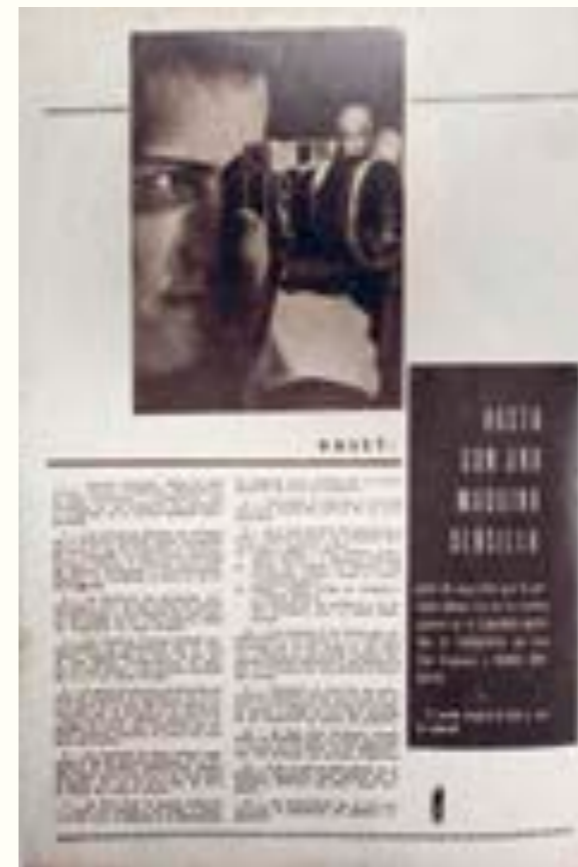
4. Mundo Uruguayo , 19 de setiembre de 1962.