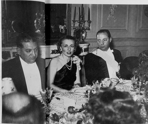
LUIS BATLLE EN UNA CENA DE GALA