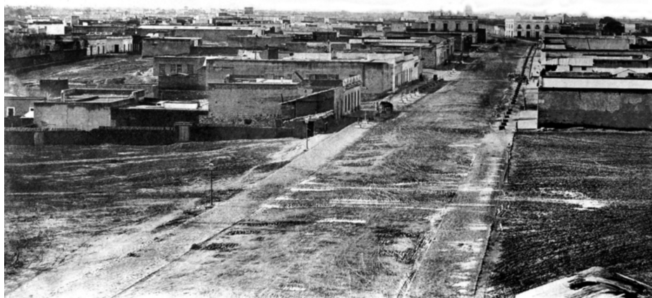
[Imagen 2] Plaza Cagancha antes de iniciarse la construcción de la “Columna de la Paz”. Año 1865. Reproducción posterior. (Foto 23B).