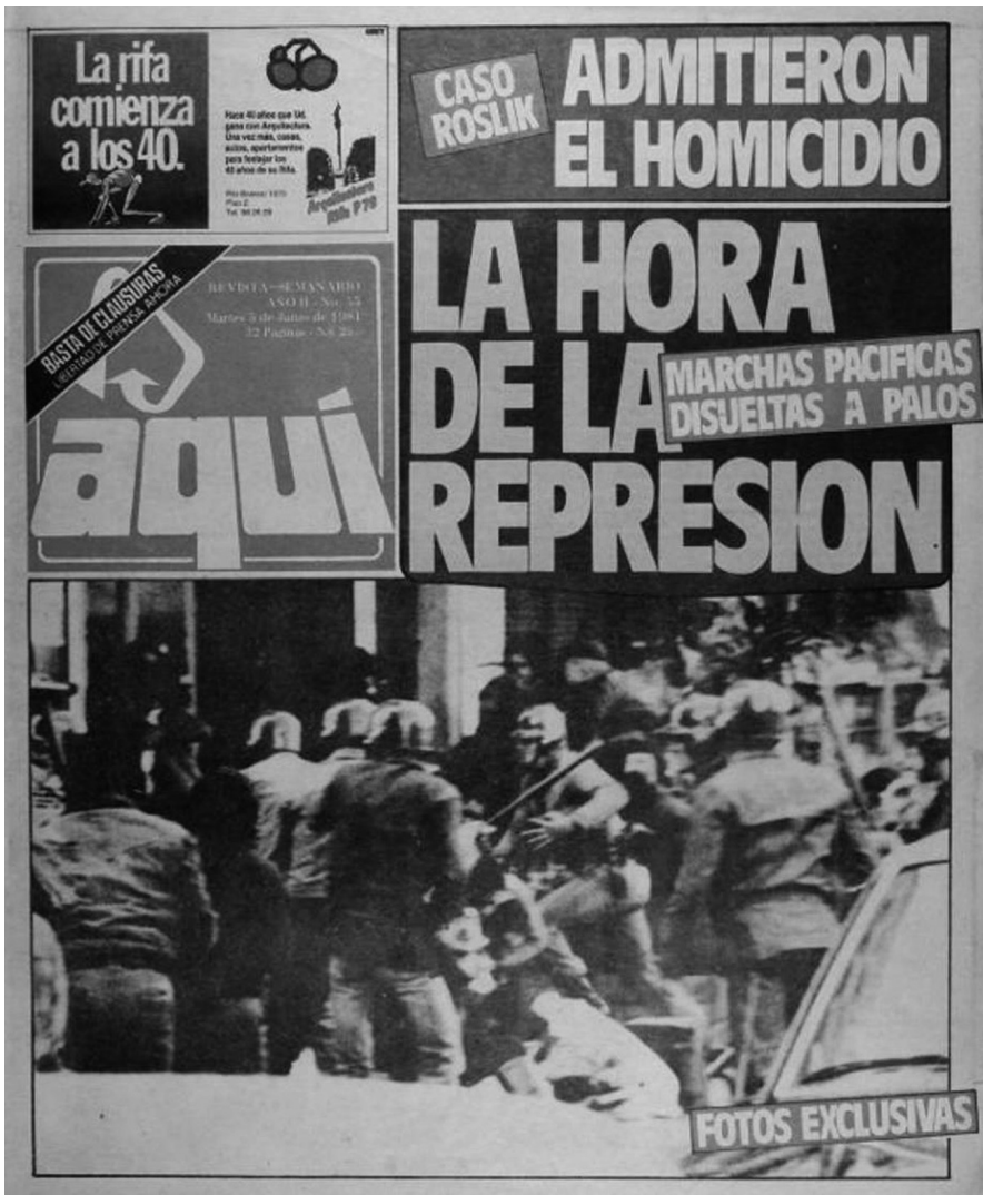
Portada e interior de diario Aquí, 5 de junio de 1984.

A su vez, la descontextualización y el uso arbitrario de las imágenes suelen ser características inherentes de las historias gráficas, nombre que alude a las series fasciculares ilustradas, construidas a modo de crónicas y compuestas por gran cantidad de imágenes, por lo general concebidas como emprendimientos comerciales desarrollados al margen de los centros de producción de conocimiento histórico e investigación. En ellas la función de las imágenes consiste en ilustrar textos que han sido escritos