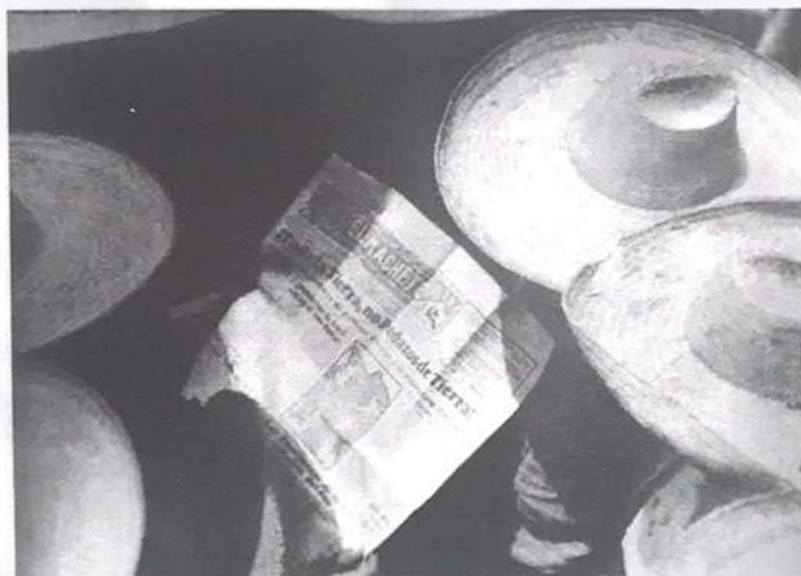
Figura 3: Hombres leyendo El Machete , Tina Modotti, 1924.

nas arqueológicas, monumentos coloniales y algunas imágenes del exotismo indígena) para retratar las manos de las personas que trabajan y exponer la crítica al monopolio informativo de las empresas y del gobierno cuando nos ofrece la imagen de unos campesinos leyendo los titulares del periódico El Machete . El titular expresaba una demanda clara en su época "¡Toda la tierra, no pedazos de tierra!" (Figura 3).