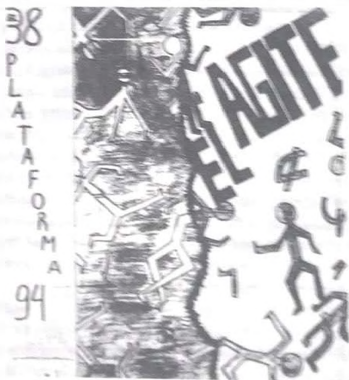
Figura 5: Boletín estudiantil El Agite, Colegio Nacional Tomás Guido, San Martín, Provincia de Buenos Aires.