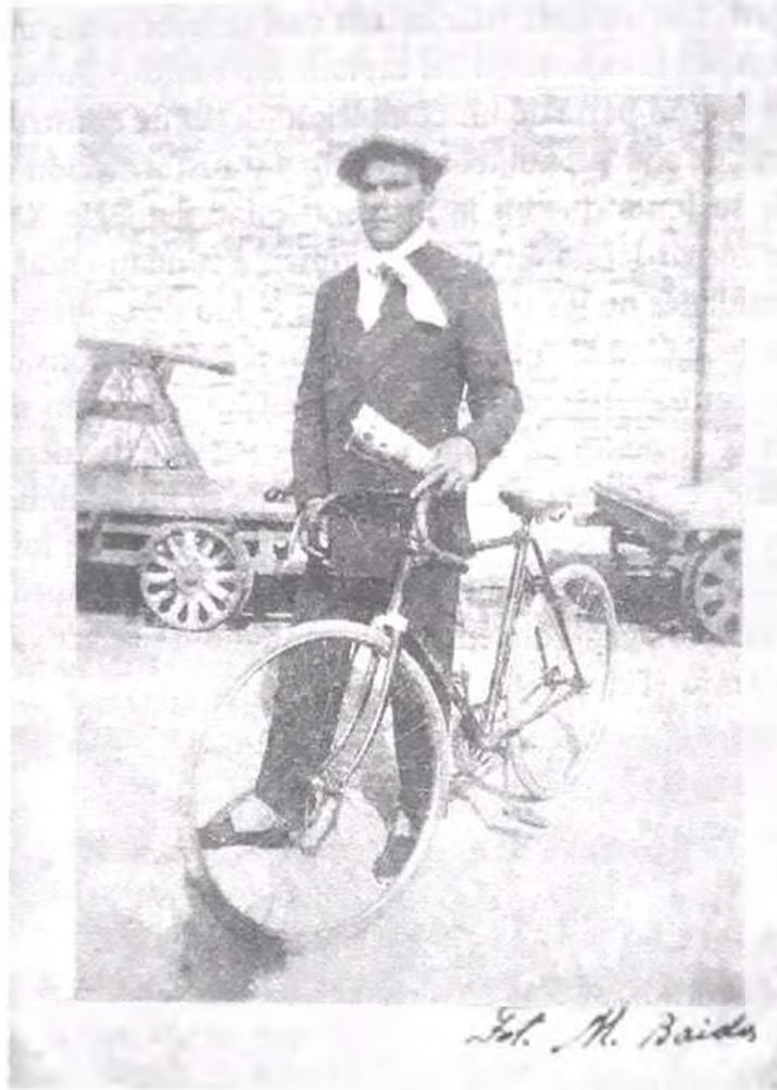
Figura 2: Obrero ferroviario, Buenos Aires, circa 1930, (gentileza de la familia Zabiuk, Berisso, Provincia de Buenos Aires).

Los obreros descubrieron el poder de la escritura, de la prensa y la difusión de ideas y algunos artistas realizaron sus intervenciones estéticas y políticas en estrecha vinculación con el mundo del trabajo y la experiencia de vida y las luchas de las clases populares. El análisis de algunos de esos vínculos se verá más adelante, ahora sólo quiero destacar dos experiencias que muestran los vínculos posibles entre artistas, prensa y mundo del trabajo. La primera fue realizada por Tina Modotti durante su estadía en el México de los años veinte. La fotógrafa rompió con las formas habituales de la representación del pintoresquismo mexicano (rui-