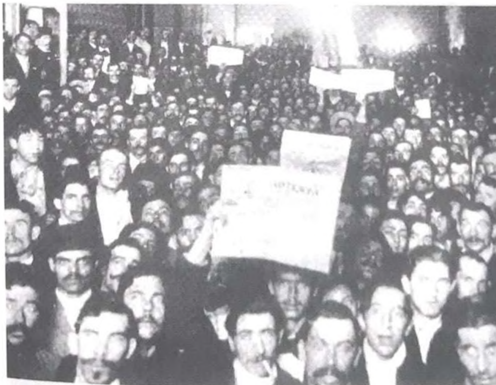
Figura 1: Obreros panaderos en el local de la calle Montes de Oca de la Ciudad de Buenos Aires muestran el diario anarquista La Protesta , 1914.

Se puede sostener que en la primera mitad del siglo XX la prensa obrera se fue convirtiendo en una herramienta fundamental para construir las identidades de los trabajadores en el Río de la Plata. La lectura como medio de acceso al conocimiento y al placer era considerada crucial por las organizaciones obreras, que la estimularon con sus publicaciones y con la creación de bibliotecas. Los periódicos fueron para las clases populares de todo el mundo un signo de su respetabilidad y de su cultura y por eso numerosas fotografías los muestran con los diarios en sus manos, aunque es cierto que desde otra perspectiva puede interpretarse como una imagen convencional resultado de la activa participación del fotógrafo (Figuras 1 y 2).