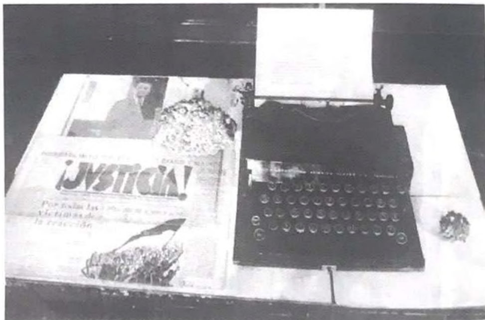
Figura 4: Ensayo de un museo libertario, Instalación, Magdalena Jitrik, 2000.

lector y con la existencia de una elite letrada que la utilizó para formar una opinión pública favorable. Pero también con las mejoras en los métodos de impresión, el desarrollo de las comunicaciones, del transporte, la mayor accesibilidad al papel de prensa y la alfabetización de vastos sectores de la población que hicieron posible la aparición de lo que se ha llamado el periódico de masas.