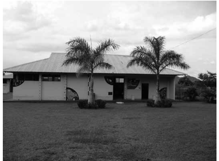
Foto 4. Ecomuseo de la Cerámica Chorotega en San Vicente, Costa Rica

En este ejemplo vemos muy bien cómo la patrimonialización puede corresponder al concepto de ecopatrimonio, ya que la finalidad del proceso es preservar la cultura y, por supuesto, promocionar una actividad tradicional. Al mismo tiempo es una forma de organizar una economía para valorizarla en un entorno competitivo y, con la generación de recursos, mejorar la calidad de vida de la comunidad. En efecto, muchos de los pueblos alrededor, y parte de la comunidad chorotega, viven también de la producción de cerámicas, y podría decirse que la competencia más fuerte es económica, pero en el pueblo de San Vicente se buscó una solución para pasar de la producción artesanal a un elemento patrimonial. La constitución del Ecomuseo, a partir de una acción común de los vecinos y gestionada por ellos, concreta esta finalidad de