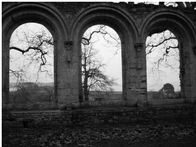
Foto 1. Ruinas de la abadía de Beauport, Francia

se encarnarían los nuevos valores de libertad, igualdad y fraternidad, y la grandeza de un pasado reinterpretado que los respalda.