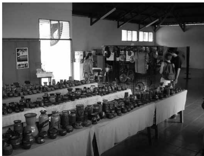
Foto 3. Cerámicas chorotegas expuestas en el Ecomuseo de San Vicente, Costa Rica

En los últimos tiempos, el país tuvo un crecimiento importante del turismo como industria, en particular en la península de Nicoya, donde muchos extranjeros, primordialmente estadounidenses, adquirieron propiedades. Aprovechando este mercado turístico, se desarrollaron varias actividades artesanales que ofrecen productos locales en las tiendas especializadas, como la cerámica, la producción textil o la confección de máscaras. La “mirada turística” hizo de estas actividades una fuente de recursos, pero también calificó