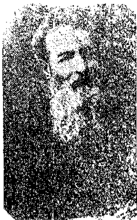
PEDRO ALZAGA Fundador de "El Imparcial"