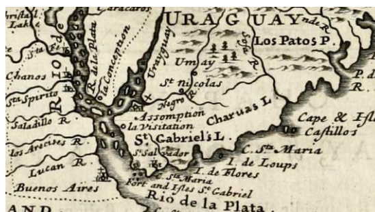
“The Great Province of Rio de la Plata”, Herman Moll, 1701

San Salvador. El mapa del jesuita Ernot de 1632, (Furlong 1936; Blaeu, 1662), (ver Figura 8), aparece un símbolo que se indica como reducción franciscana sin indicar nombre, en la desembocadura del San Salvador erróneamente ubicada en el río de la Plata frente a Buenos Aires, lo cual se interpretó como Soriano. En el texto del “ Atlas Maior ” se menciona a San Salvador a partir de las memorias de Gaboto, señal inequívoca que se trata de un registro tardío del Fuerte de Gaboto a su vez mal ubicado por una incorrecta interpretación de las crónicas por parte de los cartógrafos.