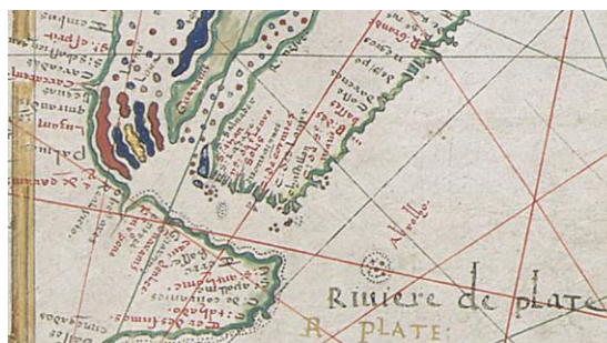
Portulano de Pierre Desceliers, 1550.

Aquí se puede observar que hipótesis que se sobre la misma base, Viegas en 1534 señala al río de los Beguás desembocando en el río de la Plata -ya con su denominación- aguas arriba del cabo de Santa María, mientras que Desceliers en 1550 lo muestra en la banda occidental del Paraná en el entorno de Sancti Espíritu, lo mismo que una indicación de otra parcialidad chaná, el río de los Timbúes. Posteriormente, la cartografía reitera la presencia del conglomerado chaná-beguá-timbú en la zona del delta del Paraná.