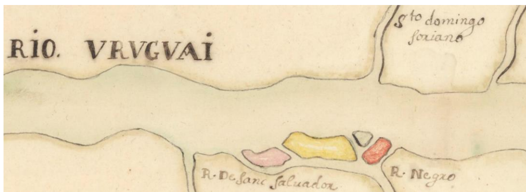
“Plano del Río de la Plata”, Juan de Herrera y Sotomayor, ~1703

Desde el inicio no deja de sorprender un mapa archivado en Francia, donde un jerarca de la talla de Pontchartrain recibe una comunicación directa de un jerarca de segundo orden de la América española. Este mapa se caracteriza por un detalle del delta del río Negro de una precisión que no se encuentra en los mapas de la época. Al mismo tiempo tiene un muy buen detalle de Punta del Este. Sin embargo, la planta general de los grandes ríos no parece muy bien planteada. Por ejemplo, el banco Ortiz aparece representado como una faja que atraviesa el río, al igual que aparecen en dos mapas de Juan Ramón, hechos en Lima en 1683.