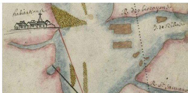
“Plan de la Rivièrre de la Platte” Coëtlogon (C-A D-B), 1708