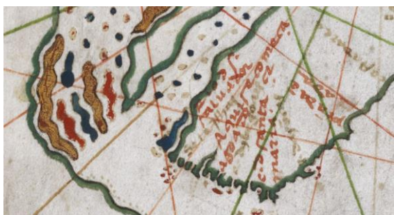
Portulano de Gaspar Viegas, 1534.