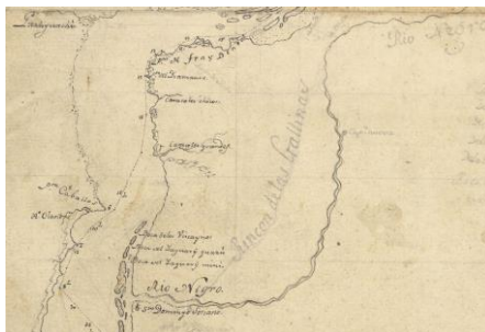
“Carta Náutica del río Uruguay”, Andrés de Oyarvide, 1801