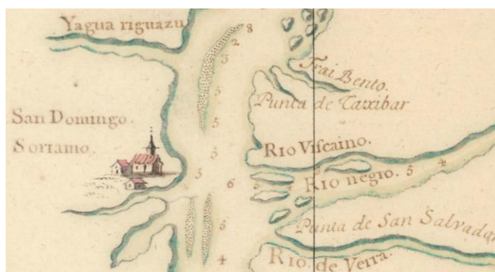
“Mapa y planta del Río de la Plata de Misiones”, Hércules Torelli, 1701

A su vez del mapa de Torelli, para la zona del río de la Plata se deriva claramente el de Guillaume de l’Isle de 1703, el cual cubre un área más amplia, la del cono sur sudamericano, apareciendo la delineación y toponimia de Torelli algo simplificada, y con evidencia notoria de ser la fuente. Cabe señalar que ello coincide con el acceso de los borbones a la corona española, y que además puede corroborar con la presencia de mapas de Torelli conservados en Francia.