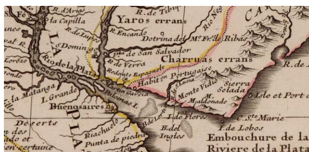
“Carte du Paraguay, du Chili, du Detroit de Magellan &c”, Guillaume De l'Isle, 1703

Otro mapa interesante conservado en la Biblioteca Nacional de Francia es uno de 1708, donde el autor se identifica por iniciales de las cuales no hay información. Una anotación en el mismo indica “ Provenant de Mr. le Maréchal de Coëtlogon ”, quien fue un marino francés