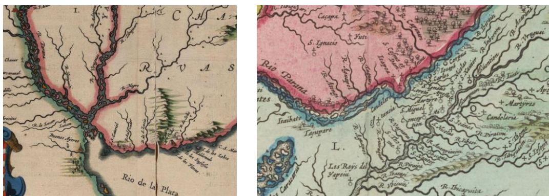
“Paraquaria vulgo Paraguay, Joan Blaeu 1662 (atribuido a Ernot 1632)

En resumen, el panorama cartográfico transmite la idea de una presencia Chaná en el delta del Paraná y de Charrúas al norte de Buenos Aires, lo cual sostiene la hipótesis de un origen Chaná proveniente de la reducción de Santiago del Baradero, así como de Charrúas que transitaban la banda Norte del Paraná-de la Plata.