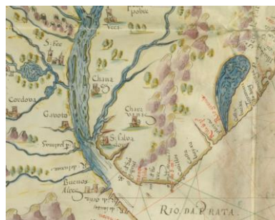
“Descripção do estado do Brasil”, João Teixeira Albernaz, 1627

En lo que sería el primer mapa de referencia Jesuita (Furlong, 1936), aparecen indicados los Charrúas en la otra banda nororiental del Paraná - de la Plata. Por otra parte, se menciona a la parcialidad chaná de los Timbúes como en cartas anteriores, y se hace referencia junto al delta del Paraná a los Quiloazas, también una parcialidad chaná-timbú.