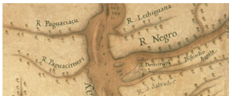
“O Grande Río da Prata”, Diogo Soares, 1731