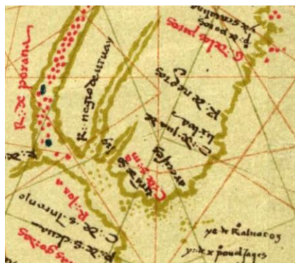
“Carta Universal”, Diego Ribero, 1529

Un antecedente relevante para el análisis del proceso fundacional de Santo Domingo Soriano es la información sobre las etnias de la región. La cartografía registra tempranamente el denominado río de los Beguás, -una de las parcialidades chanás- cuyo nombre parece remitir a la expedición de Gaboto en 1526: