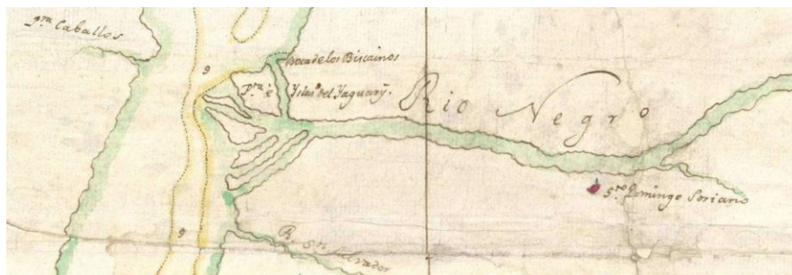
“Configuración del Desagüe del Río Paraná”, José de la Peña, 1796

En 1801 Andrés de Oyarvide por solicitud de Félix de Azara realiza un relevamiento del río Uruguay. En carta náutica conservada en el Museo Naval de Madrid, se indican las denominaciones actuales, en la margen occidental, el Gualeguaychú y el Landa (“Olanda”), y en la banda Oriental una delineación del delta del río Negro poco precisa. Se observa que en la posición del actual Yaguarí chico está el Guazú, y al sur en la boca del Yaguarí el Miní. Esto indica correlación con los Yaguarí de la otra banda, y que de ellos tomaron el nombre. Oyarvide a su vez llega al arroyo Landa (antes Yaguarí Miní), informando en su diario y registrando la batimetría. Denominado luego Puerto Landa, fue punto de ingreso al sur entrerriano, ejemplo Hilarión de la Quintana en 1814 y Lavalle en 1839.