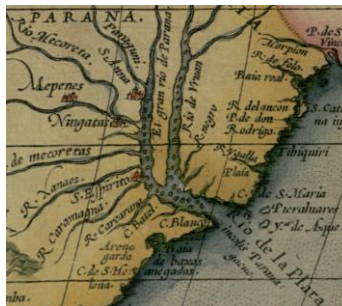
“Theatrum Orbis Terrarum”, Abraham Ortelius, 1570