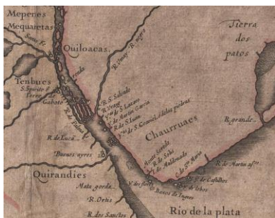
“Paraguay, ó prov. de Rio de La Plata” Willem Blaeu, 1616.